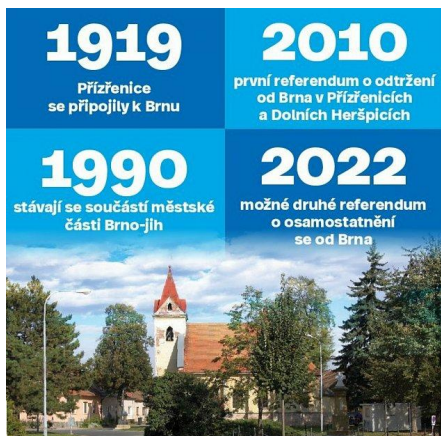
V okrajových Přízřenících zvažují odtržení se od Brna.